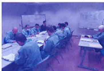
復旧計画、応急給水計画作成訓練