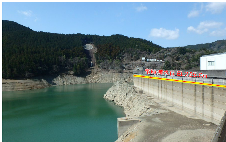
現状 (R6.3.14 : 平常時最高貯水位 - 18.12m)