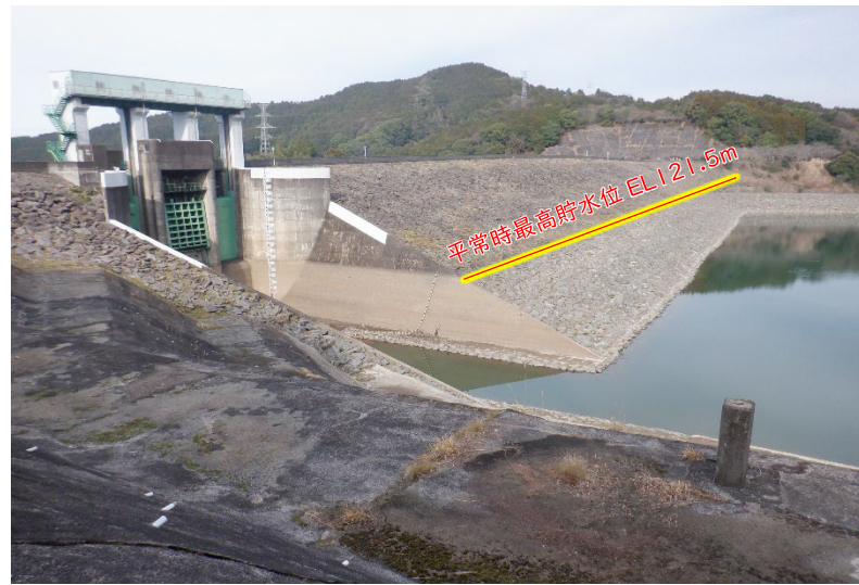
現状 (R6.3.14 : 平常時最高貯水位 - 8.77m)