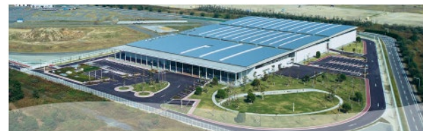
まみずピア（海水淡水化センター）とは

※筑後川水系6ダム：江川ダム・寺内ダム・小石原川ダム・筑後大堰・合所ダム・大山ダム