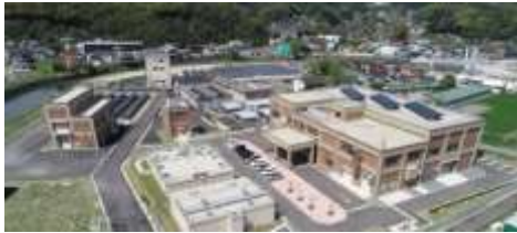
【東隈浄水場】 企業団の基幹浄水場