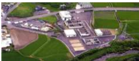
【埋金浄水場】 那珂川の上流に位置する浄水場