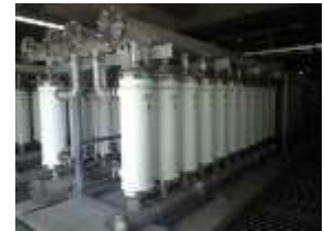
【原町浄水場】 企業団でもっとも古くからある浄水場