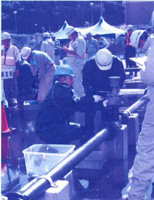
応急復旧訓練の様子 (漏水修理)

10月9日、10日に鹿児島市で行われた第7回日本水道協会九州地方支部合同防災訓練に、九州各県から40事業体、約120人が参加しました。企業団からも2名の職員が参加しました。