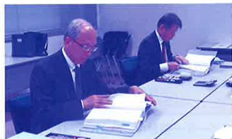
例月出納検査の様子

なお、監査等実施計画書や各監査結果等は、企業団総務課窓口または企業団ホームページでご覧いただけます。