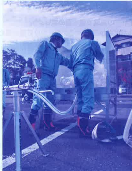
応急給水訓練の様子 (パネル式給水タンクの組立て)

11月13日、企業団単独での防災訓練を実施しました。訓練では、給水車やパネル式給水タンクを使った応急給水訓練、給水管の漏水修理による応急復旧訓練を行いました。