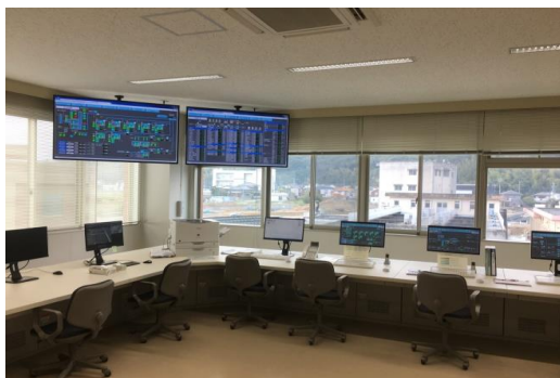
中央監視室(膜ろ過管理棟内)

浄水場の施設は、全て電力で稼働しています。 今回、自然エネルギーを利用する太陽光発電設備を旧浄水施設の跡地に設けました。 これにより地球温暖化の原因とされる二酸化炭素(Co 2 )の排出抑制など環境負荷低減に貢献するとともに電気料金節約にもなります。