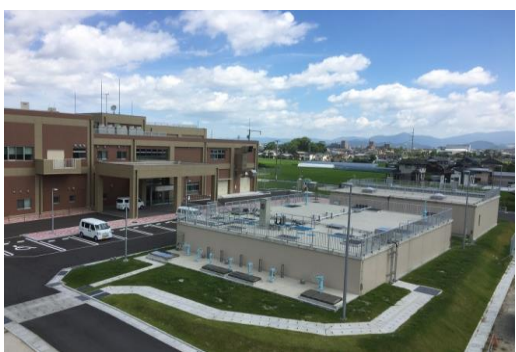
活性炭接触池(右手前)、汚泥濃縮槽(右奥)